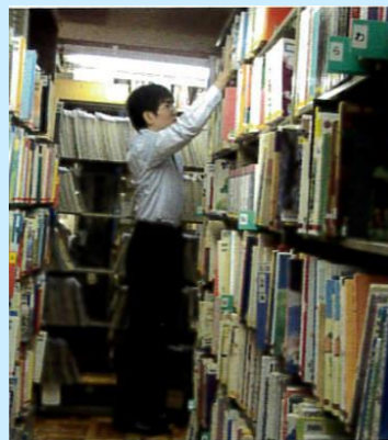
杉並区立中央図書館での職場実習の様子

今まで経験のない仕事にチャレンジでき、自分の不得意なことだけでなく、得意なことも確認できました。職場で必要なルールやマナーも勉強になりました。今後は就職を目指して頑張ります！